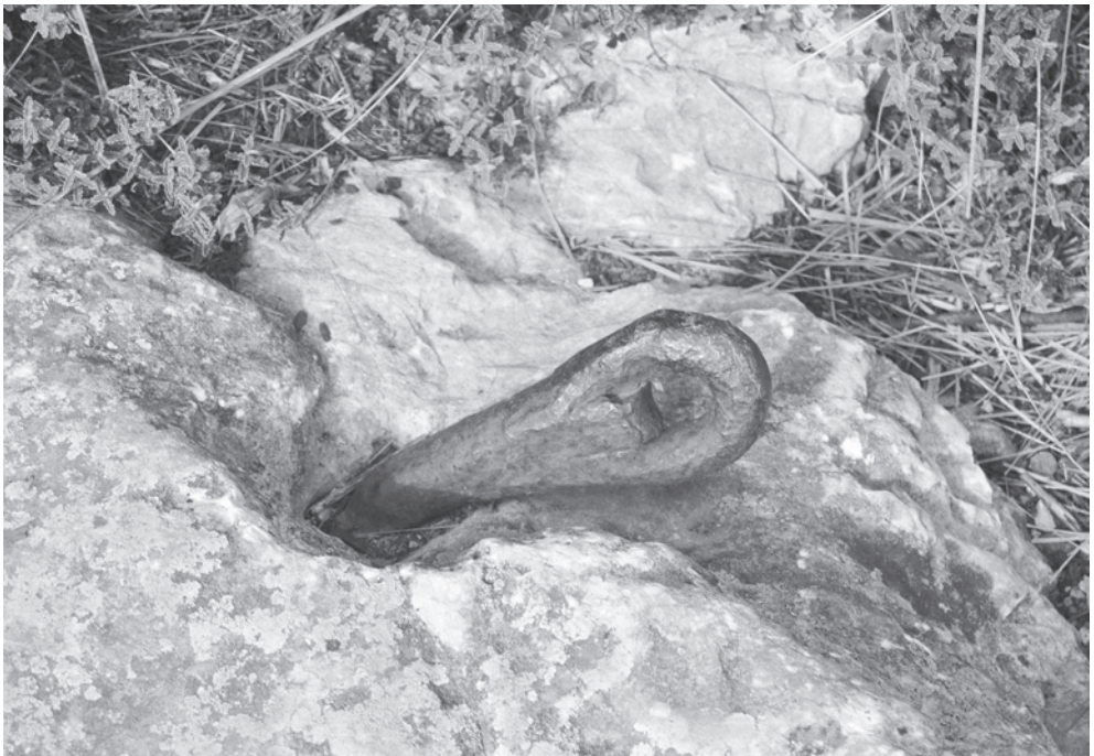
Argolla de ferro de Son Jaumell per subjectar els cables.